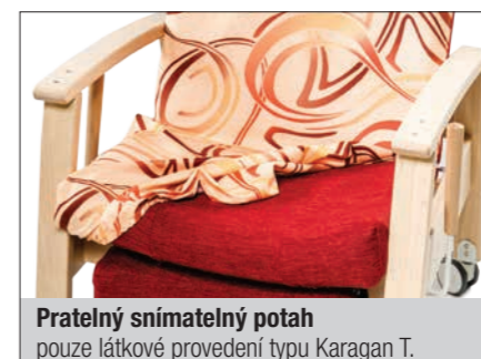
Pratelny snímatelný potah pouze látkové provedení typu Karagan T.