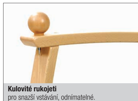
Kulovité rukojeti pro snazší vstávání, odnímatelné.