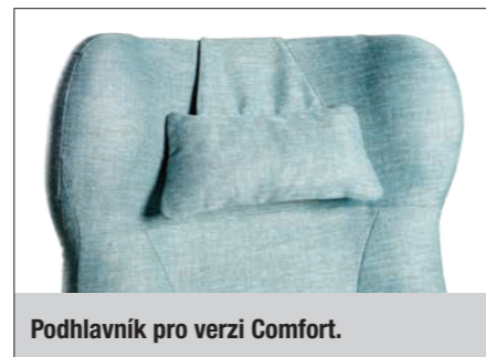
Podhlavník pro verzi Comfort.