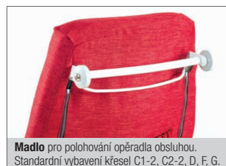
Madlo pro polohování opěradla obsluhou. Standardní vybavení křesel C1-2, C2-2, D, F, G.