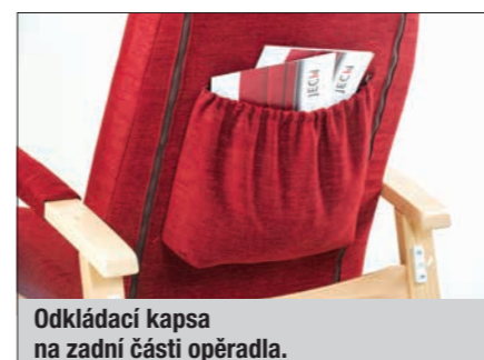
Odkládací kapsa na zadní části opěradla.