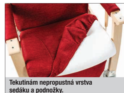
Tekutinám nepropustná vrstva sedáku a podnožky.