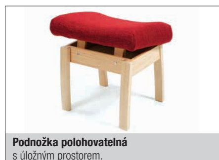
Podnožka polohovatelná s úložným prostorem.