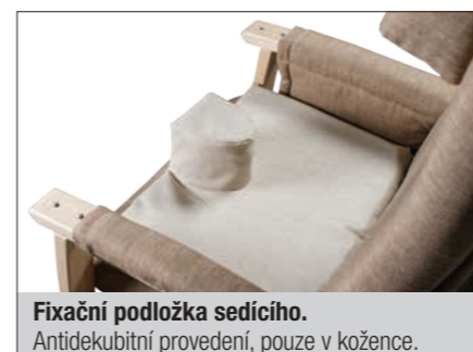
Fixační podložka sedícího. Antidekubitní provedení, pouze v kožené.