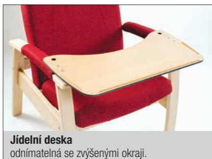
Jídelní deska odnímatelná se zvýšenými okraji.