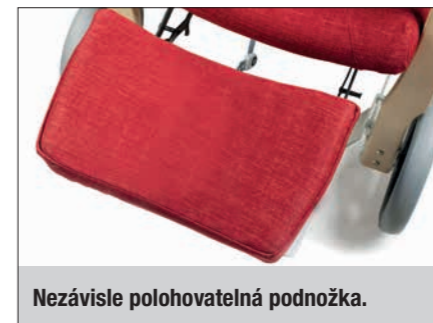
Nezávisle polohovatelná podnožka.