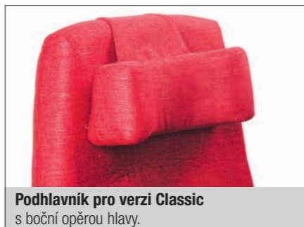
Podhlavník pro verzi Classic s boční opěrou hlavy.