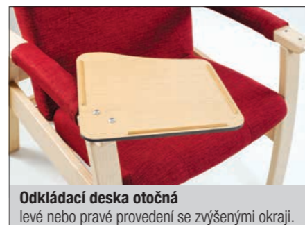
Odkládací deska otočná levé nebo pravé provedení se zvýšenými okraji.