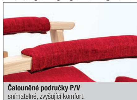
Čalouněné područky P/V snímatelné, zvyšující komfort.