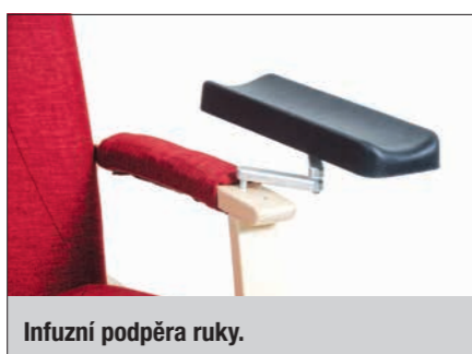
Infuzní podpora ruky.