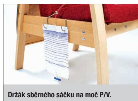
Držák sběrného sáčku na moč P/V.