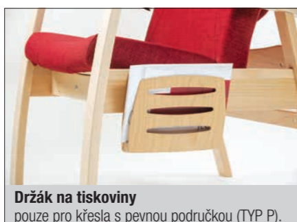
Držák na tiskoviny pouze pro křesla s pevnou područkou (TYP P).