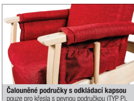
Čalouněné područky s odkládací kapsou pouze pro křesla s pevnou područkou (TYP P).