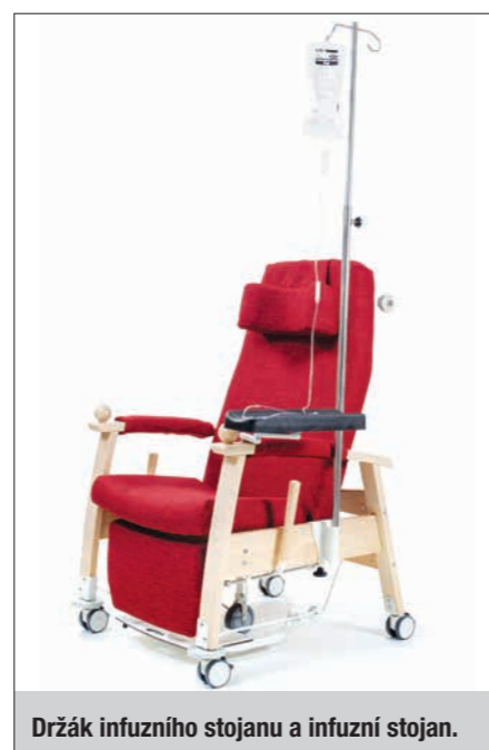
Držák infuzního stojanu a infuzní stojan.