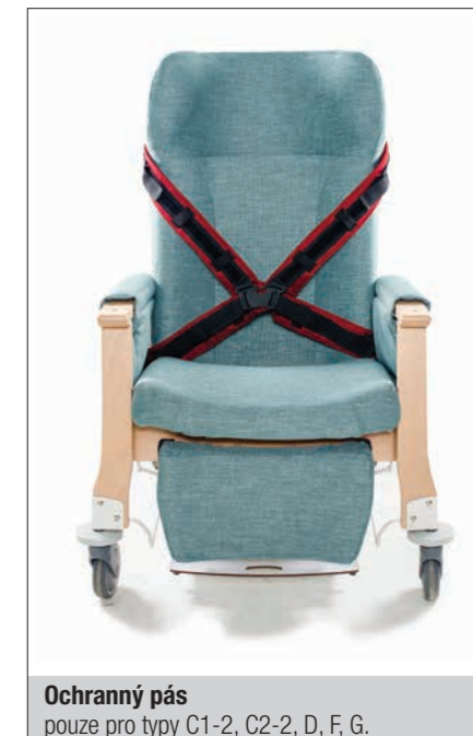
Ochranný pás pouze pro typy C1-2, C2-2, D, F, G.