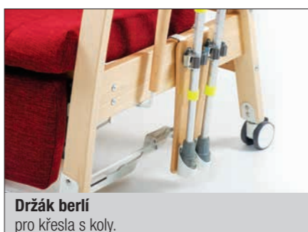
Držák berlí pro křesla s koly.