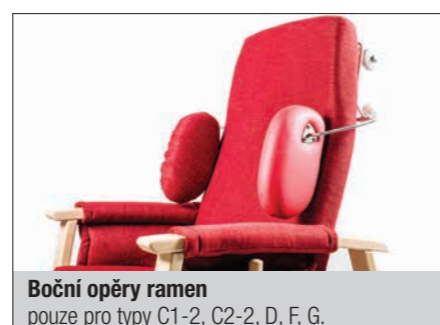
Boční opěry ramen pouze pro typy C1-2, C2-2, D, F, G.