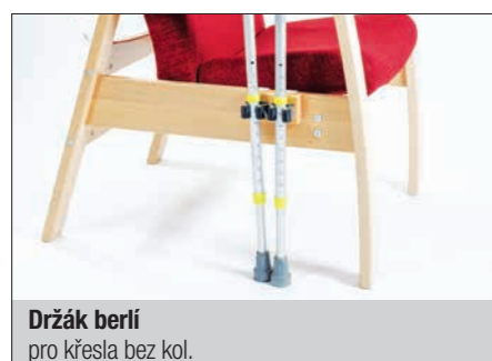
Držák berlí pro křesla bez kol.